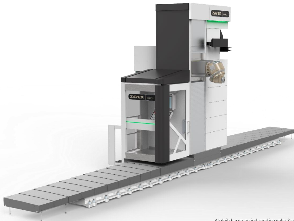
Abbildung zeigt optionale Sonderausstattung

30°-Universalfräskopf, 30- bis 80-fach Werkzeugwechsler, Rundtische, Plattenfelder, Funkmesstaster, ZAYER iCal., Anwendungs-Apps, Pendelbearbeitung, u.v.m.