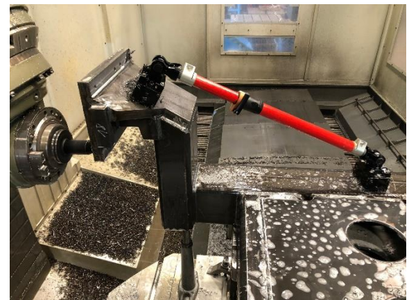
Anwendungsbeispiel auf ZAYER Xios G