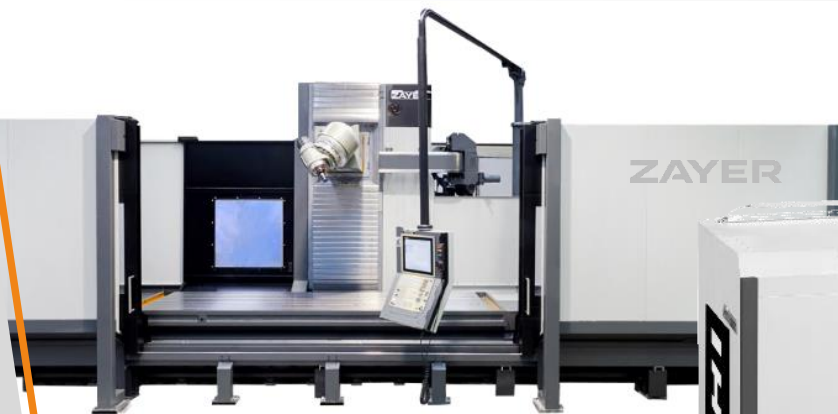
ZAYER Xios 4000