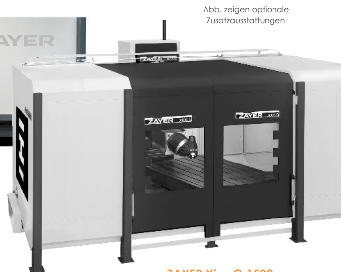
ZAYER Xios G 1500