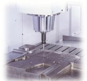
Verlängerter Spindelausgang (SV)

Auf Wunsch vermitteln wir Ihnen auch gerne ein für Sie maßgeschneidertes Finanzierungs- oder Leasingmodell.